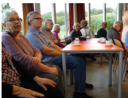
Het publiek in Banjaert