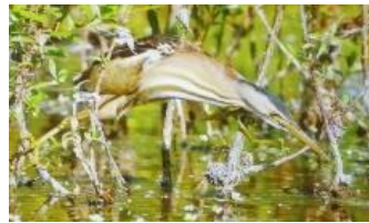
woudaapje (is een soort reiger)