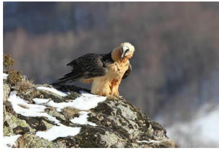
Gieren in de Pyreneeën