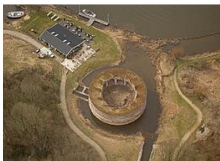
Fort Uitermeer, ten oosten van Weesp gelegen

Weesp is een van rijkswege beschermd stadsgezicht, met een oppervlakte van 45.7 hectare, gelegen tussen de Vecht en het Amsterdam-Rijnkanaal. De stad telt mét de naburige kernen De Horn en Uitermeer bijna 21.000 inwoners.