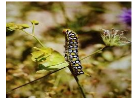
Wolfsmelk pijlstaart vlinder rups