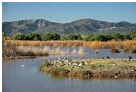
Delta del Llobregat