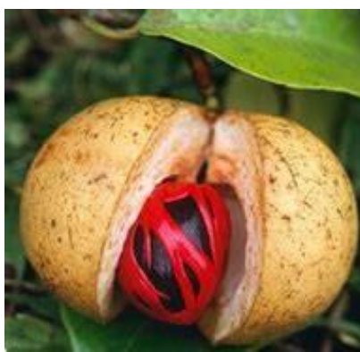
Muskaatnoot, met rode foelie