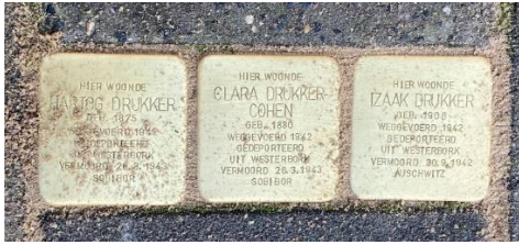
Struikelstenen bij Vinkenstraat 92

Woensdagmiddag 13 september 2022, het is mooi zonnig wandelweer!