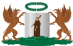
Wapen van Monnickendam, in 1816 officieel vastgesteld.

van de Zuiderzee. Monnickendam werd voor het eerst genoemd in 1288. Twee mogelijke verklaringen voor de naam: 1) Op dammen in een vestinggracht werden soms stenen torentjes geplaatst om het (illegaal) oversteken van de dam te bemoeilijken. Die torentjes werden ook wel 'monniken' genoemd, zo zou Monnickendam aan zijn naam gekomen zijn. 2) Tot in de 13 e eeuw stond het gebied onder invloed van het Friese Norbertijner klooster Mariëngaarde. Monniken uit dit klooster bezorgden Monnickendam mogelijk zijn naam. In het wapen van Monnickendam komt ook een monnik voor.