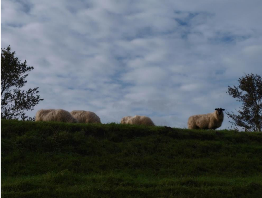
Schapenwolkjes boven de Geniedijk.