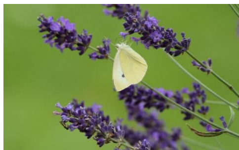
Kleine Koolwitje op Lavendel

Voor nu, een hele fijne maand en veel leesplezier. Tot 11 september.